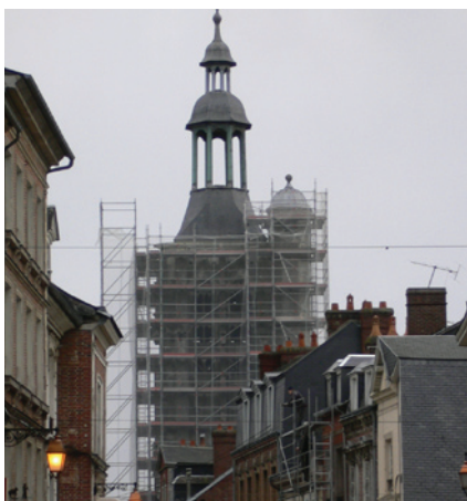
Ci-contre : vue des travaux depuis le centre ville