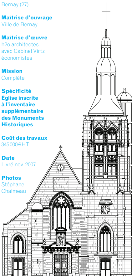
Relevé de la façade occidentale (relevé h2o architectes)