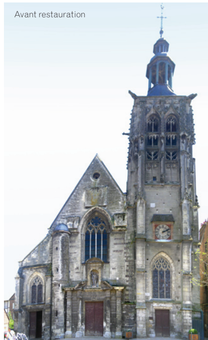
Haut : gargouille avant et après restauration Ci-dessus : façade occidentale avant restauration