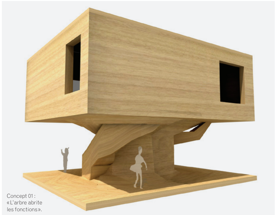
Concept 01 : « L'arbre abrite les fonctions ».