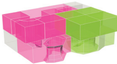
Axonométrie d'imbrication des programmes. Axonométrie de l'étage.